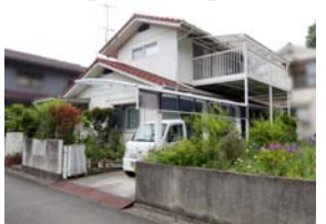
※川上小・川内中学校区