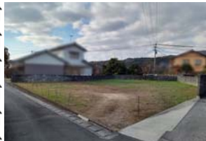
※北吉井小・重信中学校区