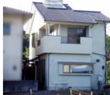
※小野小・小野中学校区