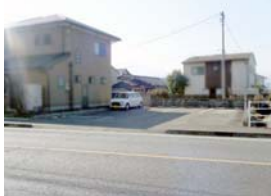
小野小・小野中校区