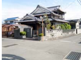
建物2棟あり・北西角地