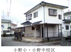
小野小・小野中校区