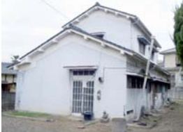
小野小・小野中学校区