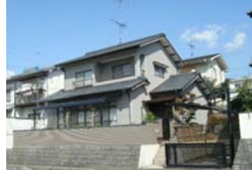
川上小・川内中学校区