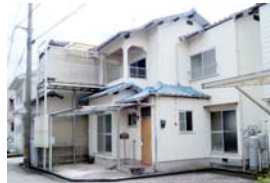
小野小・小野中校区