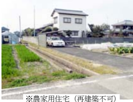
※農家用住宅 (再建築不可)