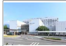
愛大医学部附属病院(1,180m)